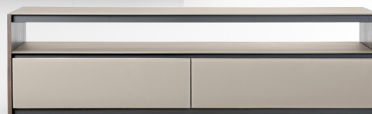
2 drawers/ 2 tiroirs