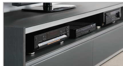
Space for electronic accessories. Espace pour accessoires électroniques.