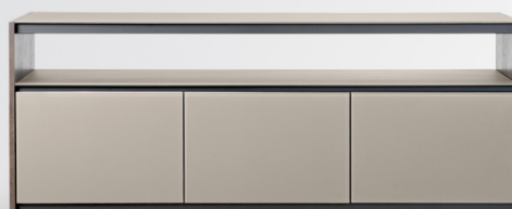
3 doors/ 3 portes