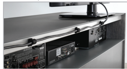
Velcro straps included to attach wires. Velcros inclus pour fixation des câbles.