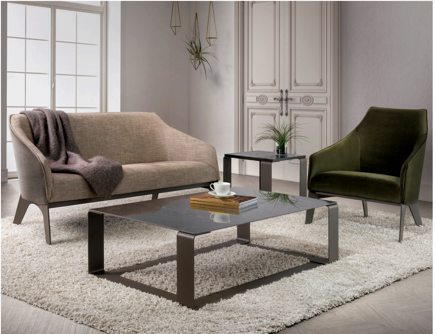
TABLE COLLECTION / COLLECTION DE TABLES